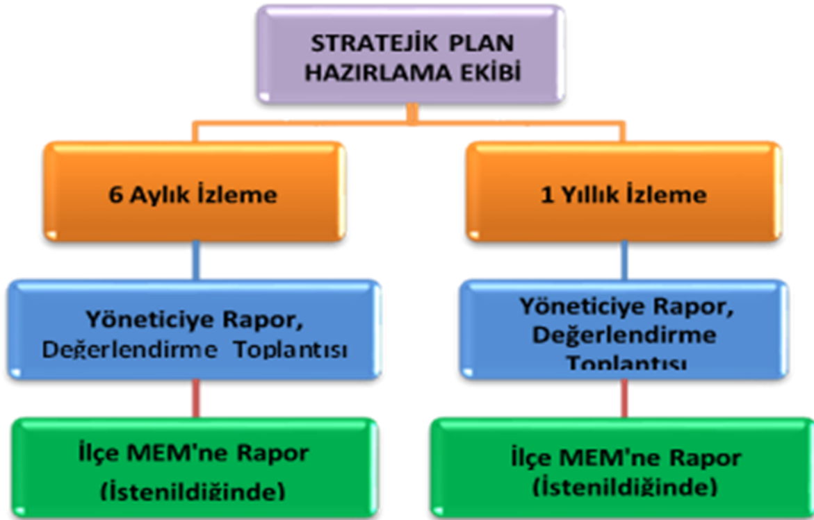
Şekil 3: İzleme ve Değerlendirme Süreci

Müdürlüğümüzün 2019-2023 Stratejik Planı İzleme ve Değerlendirme sürecini ifade eden İzleme ve Değerlendirme Modeli hazırlanmıştır. Müdürlüğümüzün Stratejik Plan İzleme- Değerlendirme çalışmaları eğitim-öğretim yılı çalışma takvimi de dikkate alınarak 6 aylık ve 1 yıllık sürelerde gerçekleştirilecektir. 6 aylık sürelerde rapor hazırlanacak ve değerlendirme toplantısı düzenlenecektir. İzleme-değerlendirme raporu, istenildiğinde İlçe Millî Eğitim Müdürlüğü'ne gönderilecektir. Ayrıca ilçemizin Mülki İdari Amirine sunulacaktır. 1 yıllık izleme-değerlendirme çalışmaları, Stratejik Planımızda yer alan hedeflerin yıllık düzeyde ifade edildiği Performans Programı ve yılsonunda gerçekleşme düzeylerinin belirlendiği Faaliyet Raporu hazırlanarak yapılacaktır.